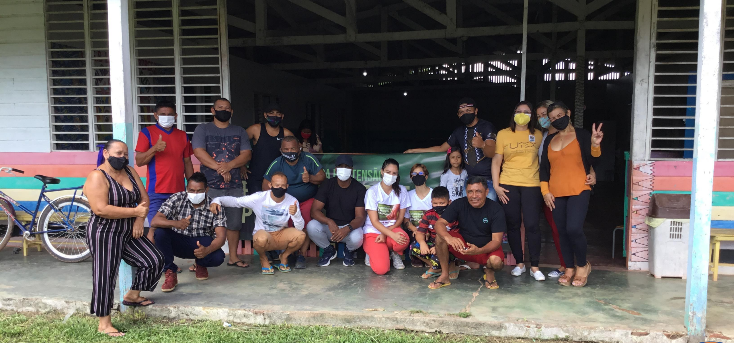
Registro Pós Roda de Conversa com Homens Pais da Ilha de Santana